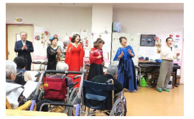
△音楽ボランティア