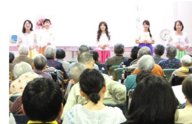
△ミュージカルボランティア △イオン移動販売